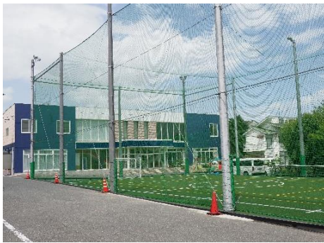
園舎とグラウンド