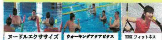
ヌードルエクササイズ ウォーキングアクアピクス TRX フィットネス

アクアクラフワールド 受付営業時間 火~土 10:00~20:00 TEL0299-92-1170 定休日 毎週月曜日 日 10:00~16:00