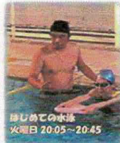
はじめての水泳 火曜日 20:05~20:45