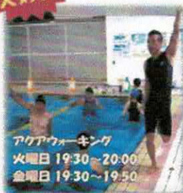
アクアウォーキング 火曜日 19:30~20:00 金曜日 19:30~19:50